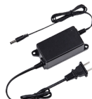
PFM320 12 V/2 A-Netzteil