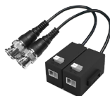
PFM800-E Passives HDCVI-Balun