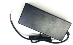
E080-1A360223B3 Блок питания